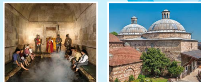
Caldas da Rainha (Portugal), Bursa (Türkei), Budapest (Ungarn)

Seit jeher fühlen sich die Menschen von den heißen heilenden Wassern und Quellen Europas angezogen. Im Laufe der Jahrhunderte begründeten die Griechen, Römer, Osmanen und andere Völker Badetraditionen und errichteten Gebäude, um das Wasser so zu nutzen, dass die Menschen darin baden konnten. Nachfolgende Zivilisationen errichteten medizinische Komplexe und entwickelten Zeremonien rund um die heilenden Wasser und im 18. Jahrhundert wurde es regelrecht zu einer Kunst, das Wasser für die Gesundheit zu nutzen – davon zu trinken und darin zu baden.