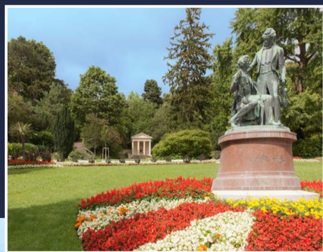
Baden bei Wien (Österreich)

Die Zertifizierung als Kulturroute des Europarates ist äußerst wichtig für die „European Historic Thermal Towns Association (EHTTA)“. Der Verband schätzt den Erfahrungsaustausch mit anderen Kulturrouten des Europarates. Dabei setzt er auch auf die steigende Wahrnehmung des Kulturrouten-Programms auf europäischer