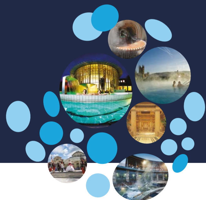
Photo credits: Bath: Bath and North East Somerset Council | Ourense: drawing by Luis Ruiz Padrón for the EHTTA Source Project | Baden bei Wien: Romana Fürnkranz | Caldas da Rainha: Municipality of Caldas da Rainha | Bursa: Bursa Metropolitan Municipality | Budapest: Budapest Spas | Łądek-Zdrój: Kurort Łądek-Zdrój | Daruvar: Ratko Vuković | Spa: Ville de Spa | Royat: drawing by Elsie Herberstein for the EHTTA Source Project | Castrocaro Terme e Terra del Sole: Comune di Castrocaro Terme e Terra del Sole | Baden-Baden: Torben Beeg

Layout: Wiesbaden Congress & Marketing GmbH