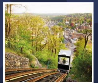
Łądek-Zdrój (Polen), Daruvar (Kroatien), Spa (Belgien)